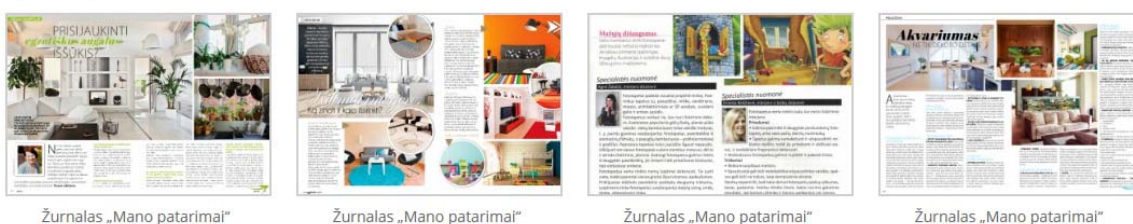
Žurnalas „Mano patarimai“